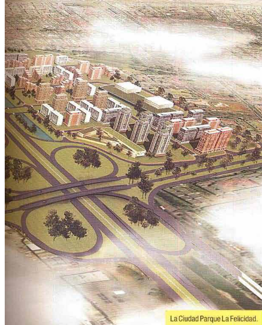
La Ciudad Parque La Felicidad.